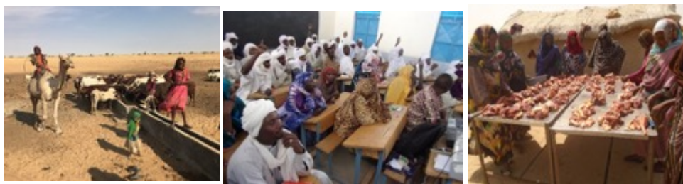
Photo 2 : les résultats de la phase 1 du PREPAS en image

Fortes des acquis et succès de la première phase, CA17 International s'est vu confier par la DDC la mise en œuvre d'une deuxième phase qui s'exécutera du 1 er Juillet 2018 au 30 juin 2021, soit sur une durée de 3 ans. Pour marquer cela, un atelier technique de démarrage s'est tenu le 5 Juillet 2018 dans la salle de réunion de la Cellule permanente à N'Djamena, avec les représentants des Ministères de l'Élevage et des Productions Animales, la Plateforme Pastorale, les représentants du Ministère de l'Environnement, de l'Eau et de la Pêche et les représentants des Programmes de développement pastoral PRAPS et PASTOR.