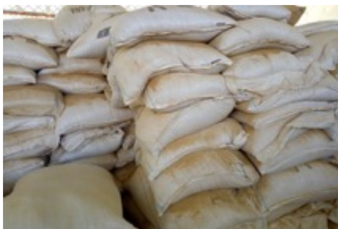
Photo 3 : Aliments de bétail stockés dans les magasins

Pour l'année 2018, quoique les prévisions de précipitation soient favorables pour les zones précédemment en crise, le Gouvernement du Tchad a déjà anticipé en présentant un plan prévisionnel au PTF qui ont d'ailleurs répondu favorablement à cette requête au cas où il y aurait d'éventuelles poches de sécheresse qui pourraient entraîner une nouvelle crise.