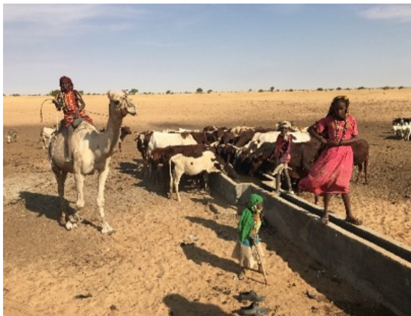
Ph. 1 : les points d'eau sont au cœur des systèmes pastoraux