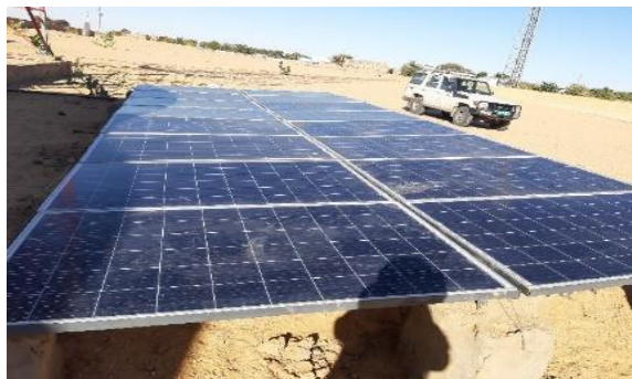
Equipements solaires installés pour les radios ONAMA.