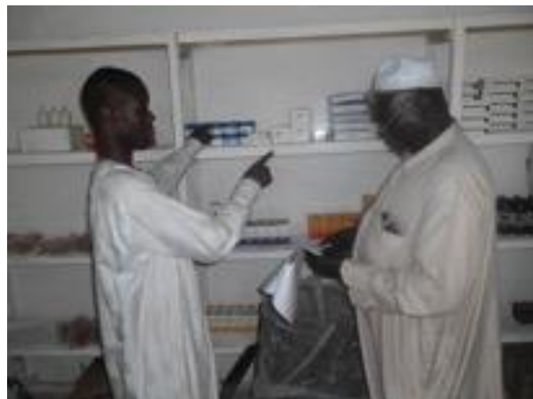
De gauche à droite Promoteur et le Chef de poste vétérinaire au dépôt pharmaceutique vétérinaire d'Oum Hadjer