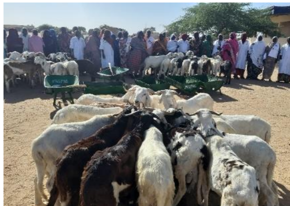
Petits ruminants mis à disposition de l'OPEF Al Watan à Biltine.