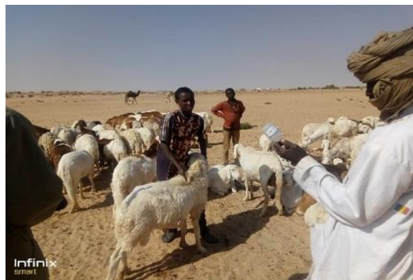
Vaccination de petits ruminants à Kalait.